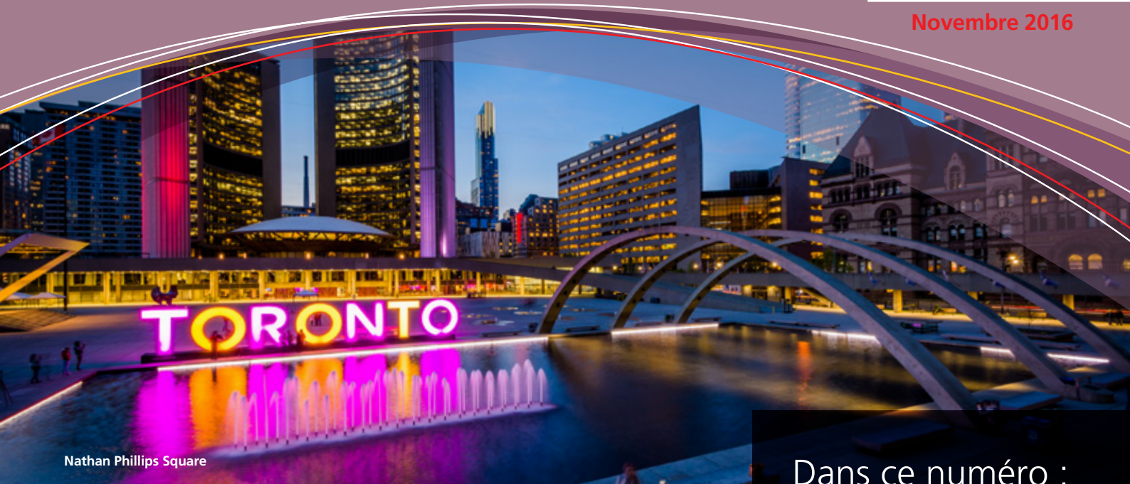
Nathan Phillips Square